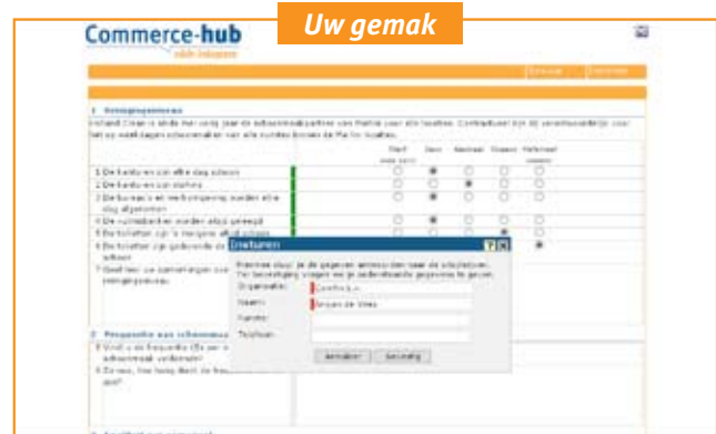
Hoe gemakkelijker de invoer, des te hoger de response! Eenvoudig te openen via de e-mail, invullen en indienen.