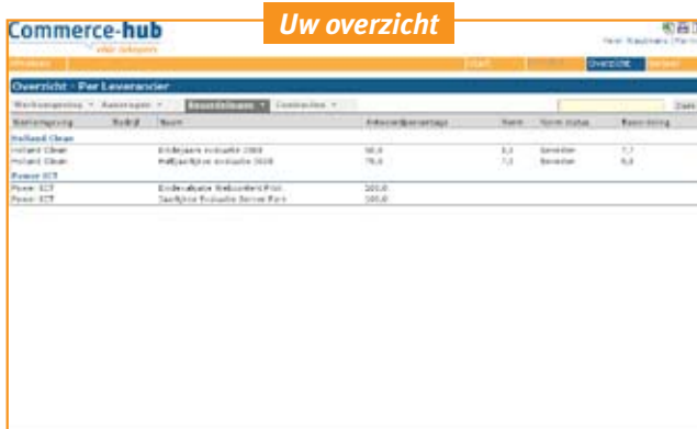
Bepaal zelf uw rapportages die als vertrekpunt dienen. Bijvoorbeeld: wie presteert onder de norm?