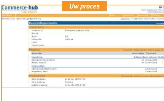
Vanuit één centrale plek kunt u de enquête instellen en krijgt u inzicht in beoordeelaars.