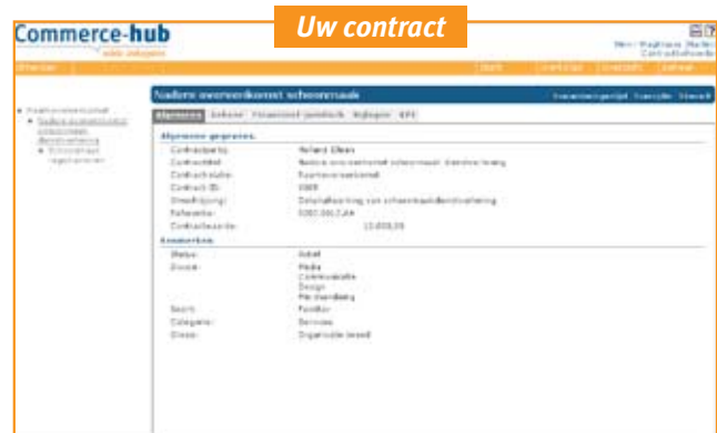
Bepaal zelf de informatie die wordt vastgelegd en organiseer deze door middel van tabbladen.