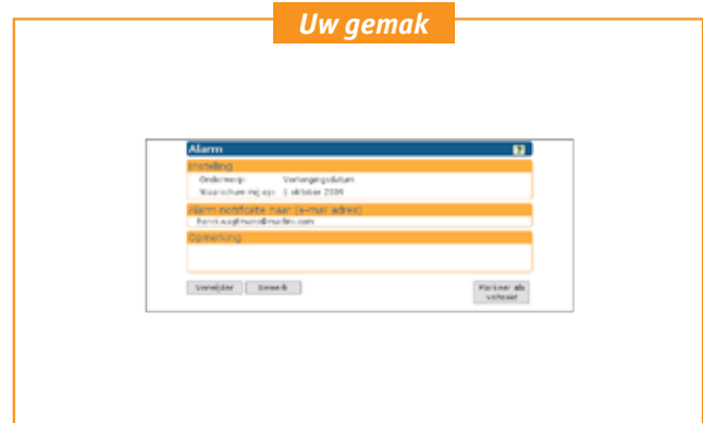
Op ieder datumveld kunt u eenvoudig een alarm plaatsen waarna u een notificatie per e-mail ontvangt.