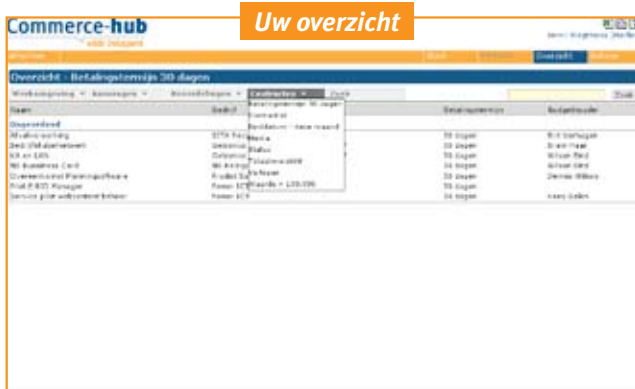
Vanuit de overzichtsc cockpit heeft u direct toegang tot de contracten die u zoekt.