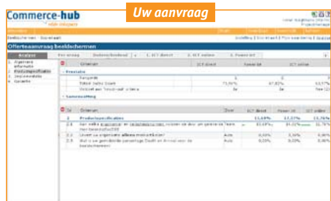
Het eindresultaat: een gefundeerde evaluatie van alle aanbiedingen. Centraal en digitaal beschikbaar voor alle betrokkenen.