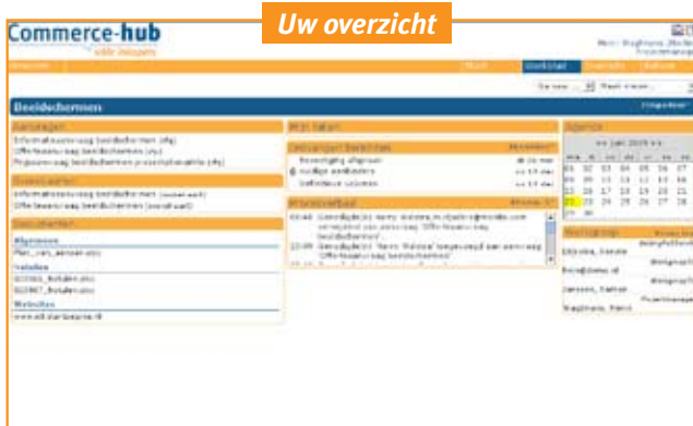
Vanuit het werkblad heeft u direct overzicht op alle elementen: offertes, evaluaties, werkgroep, planning en berichten.