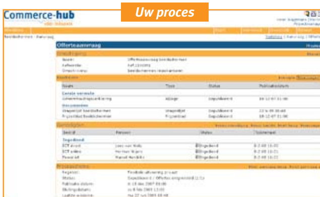
Op één centrale plek inzicht in de status van de genodigden, publicatieschema en afhandeling.